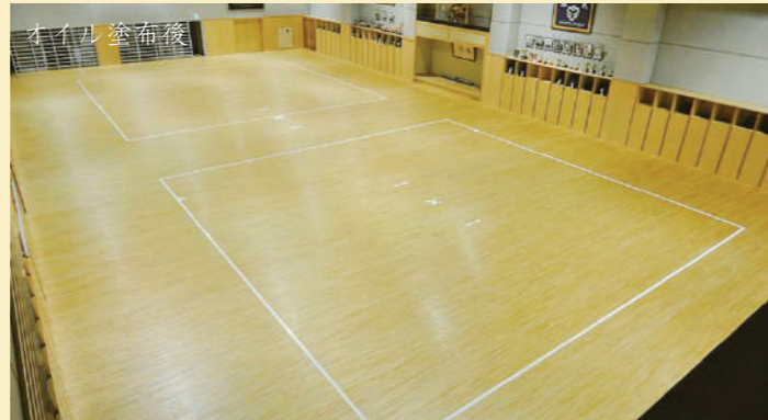
写真：日本体育大学 剣道場